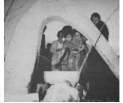
ODTÜ Rektörlük binasında asılı fotoğraf panolarının birindeki bu fotoğrafın Barış Çeşmesi'nin açılışında çekildiğini sanıyorum.