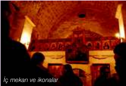
İç mekan ve ikonalar