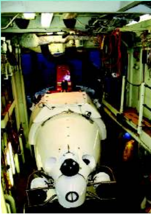
Alvin gün ağırlarken hangarından yeni bir dalış için ayrılıyor.

Peki, hidrotermal kaynaklar etrafında, mutlak karanlık ve yüksek basınçlarda nasıl oluyor da canlı hayatı mümkün olabiliyor? Gezegenimizin yüzeyindeki canlı yaşamı güneşin sağladığı