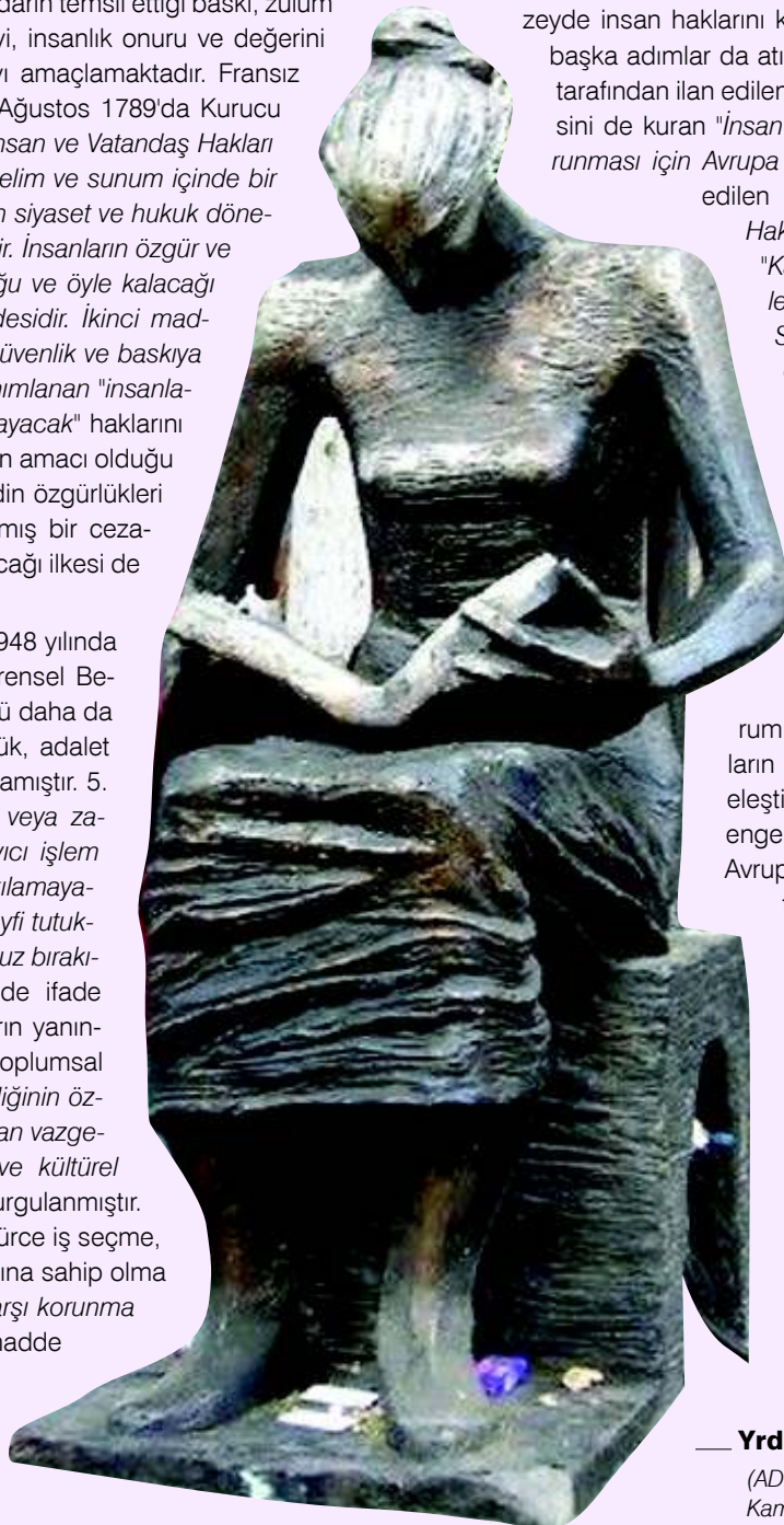
İnsan Hakları Heykeli, Yüksel Caddesi/Ankara

Birleşmiş Milletler tarafından 1948 yılında kabul edilen İnsan Hakları Evrensel Beyannamesi, bu haklar bütününe daha da geliştirmiş ve dünyada özgürlük, adalet ve barışın zemini olarak tanımlamıştır. 5. maddede, "Kimsenin işkence veya zalim, insanlık dışı veya aşağılayıcı işlem ve cezalandırmaya maruz bırakılmayacağı" belirtilmiştir. "Kimsenin keyfi tutuklama, gözaltı veya sürgüne maruz bırakılmayacağı" ilkesi, 9. maddede ifade edilmiştir. Bu gibi temel hakların yanında 22. madde ile insanların toplumsal güvenlik hakkına ve "insan kişiliğinin özgür gelişimi ve onuru bakımından vazgeçilmez ekonomik, toplumsal ve kültürel haklara" da sahip oldukları vurgulanmıştır. 23. maddede ise çalışma, özgürce iş seçme, adil ve olumlu çalışma koşullarına sahip olma haklarının yanı sıra "işsizliğe karşı korunma hakkı" da tanımlanmıştır. 25. madde herkesin kendisi, ailesinin sağlığı ve refahı için temel gereksinimlerini (sağlık hizmeti, barınma, gıda, giyim