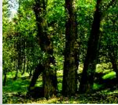
Barış Çeşmesi'nin hemen yanındaki üçüz ağaçlar sanki çeşmenin özel bir parçasıdır. Doğa çeşmedeki güzelliğe bu ağaçlarla eşlik etmiş.