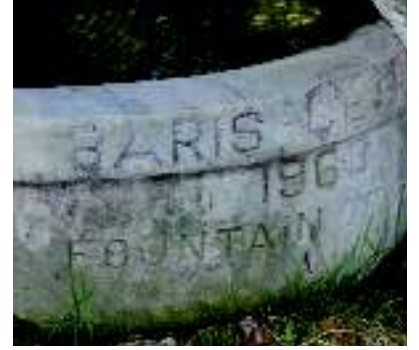
Yuvarlak mermer haznenin üzerinde "Barış Çeşmesi - Fountain of Peace - 1963" yazıyor.