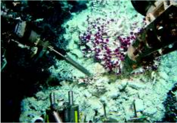
'Tevnia' tüp solucanları etrafında ölçümler yapılıyor.

diğini görmek büyük bir keyif. Yaptığımız iş bir bakıma tersine mühendislik, yani bir süreç tasarımı yerine doğada zaten varolan süreçleri ve bunların birbirleriyle etkileşimini ortaya çıkarmak. Bu bağlamda benim doktora konum oksijensiz ortamlardaki demir ve sülfür döngüsü ve bu döngünün önemli bir ögesi de okyanus tabanındaki hidrotermal kaynaklar. Yerkürenin kabuğunu oluşturan levhaların birbirinden ayrıldığı ya da çarpıştığı bölgelerdeki yoğun volkanik aktivite sonucu sıcak (100-400 °C) ve kimyasal kompozisyonu çok farklı (oksijen içermeyen, indirgenmiş) su çıkışının olduğu bu bölgeler henüz yeni keşfediliyor ve her geçen gün bu süreçlerin okyanus biyojeokimyası için ne kadar önemli olduğu ortaya çıkıyor. Ayrıca, mutlak karanlığın ve yüksek basıncın hakim olduğu bu bölgeler, çok zengin bir biyolojik çeşitlilik gösteriyor. Benim de bu bölgelerden birine, Doğu Pasifik Sırtı diye geçen bölgeye düzenlenen araştırma seferlerine 2007 Ocak ve 2008 Haziran'da katılma şansım oldu. Bu seferlerin içeriği Alvin araştırma denizaltısıyla okyanus tabanına dalıp orada gözlemler yapmak, örnekler toplamak, resim ve hareketli görüntü kaydetmek olarak özetlenebilir. Şu ana kadar iki kere katılma şansı bulduğum bu Alvin dalışlarından, özellikle 2511 metre derinliğe indiğim ilk dalışımdan biraz daha detaylı bahsetmek istiyorum.